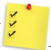
TABLEAU SYNTHÈSE FRAIS DU SERVICE DE GARDE